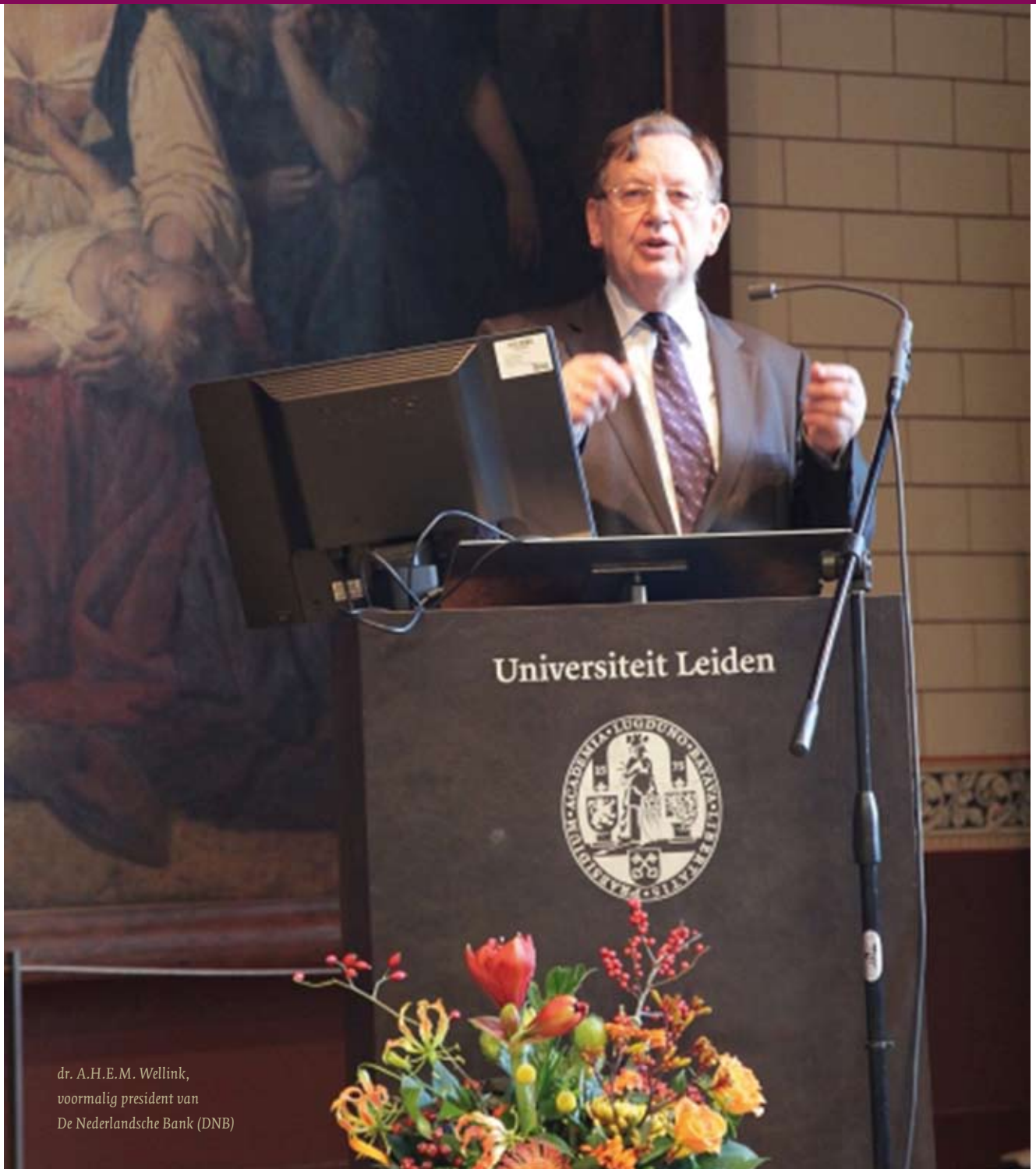
dr. A.H.E.M. Wellink, voormalig president van De Nederlandsche Bank (DNB)

fessor nog naar de alternatieve methode van faillissementsafwikkeling die in de Renaissance gebruikelijk was in de Italiaanse stadstaat Padua. Hier moest de failliete bankier naakt op de Pietra del Vituperio gaan zitten en uitroepen dat hij afstand deed van al zijn bezittingen.